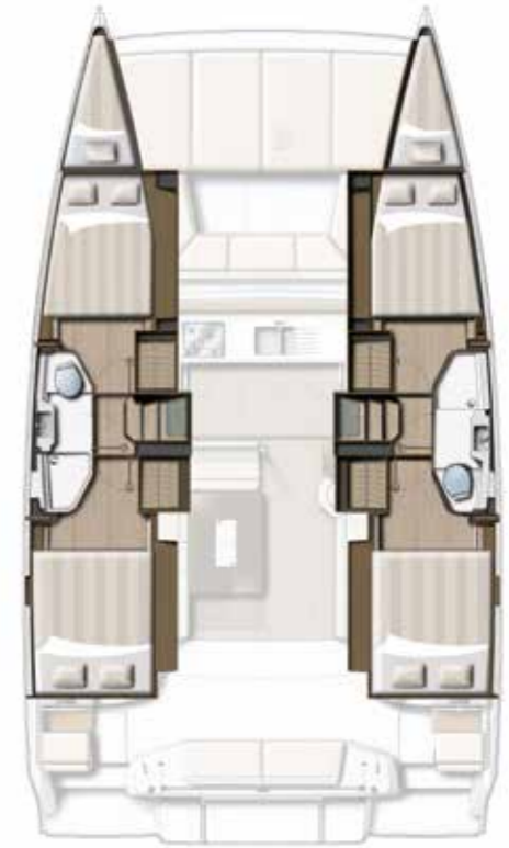
4 CABIN VERSION / 2 BATHS Versions 4 cabines DOUBLES / 2 SDB